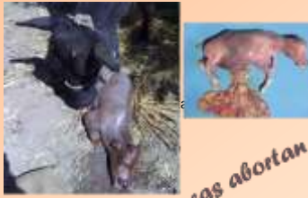
Las vacas abortan