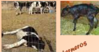
Los terneros se mueren