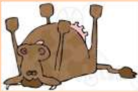
Las vacas se mueren